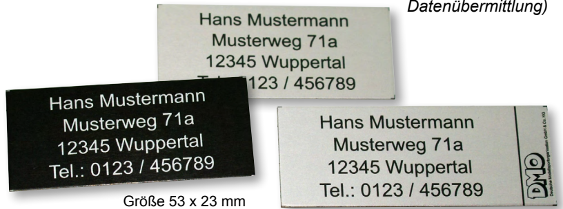
Größe 53 x 23 mm