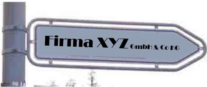
Abb. Rohrrahmen mit Bandschellen